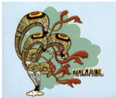
Titre de l'album : Compte complet Titre de la chanson : Le Métronome Écrite par : Thomas Augustin, Mathieu Cournoyer, Francis Mineau, Julien Mineau Auteur - compositeur - interprète : Malajube Éditée par : Third Side Music Année de publication : 2006

Utilisez le vidéoclip de la chanson pour la deuxième écoute. Ce vidéoclip semble tout droit sorti des années 1970, sans